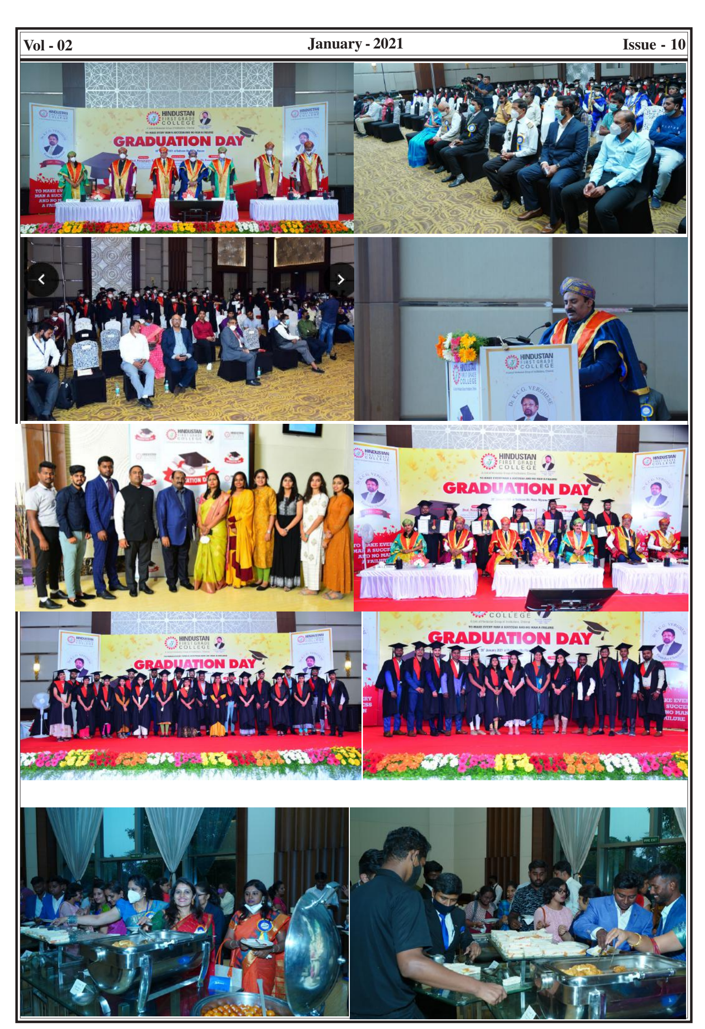
Page - 7