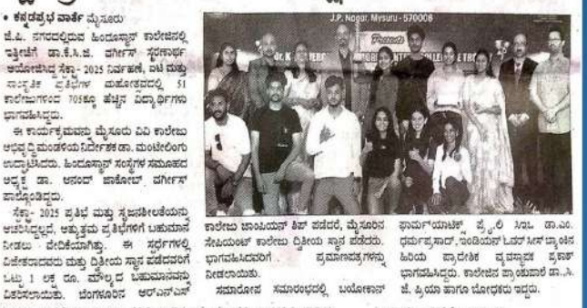
ಮಹಿಳೆ ಮತ್ತು ನಿರೀತಿಯ ಮಹಿಳೆಯರು, ವಿವಿಧ ಪ್ರಾಥಮಿಕ ಹಂತದ ವಿದ್ಯಾರ್ಥಿಗಳು | ಬಹುಮಾನದ ಸಂದರ್ಭದಲ್ಲಿ ಸೆಕ್ಟಾ-ವಿಜೇತರಿಗೆ 1 ಲಕ್ಷ ರು. ಬಹುಮಾನ