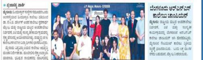
ಮಹಿಳೆ ಮತ್ತು ನಿರೀತಿಯ ಮಹಿಳೆಯರು, ವಿವಿಧ ಪ್ರಾಥಮಿಕ ಹಂತದ ವಿದ್ಯಾರ್ಥಿಗಳು | ಬಹುಮಾನದ ಸಂದರ್ಭದಲ್ಲಿ ಸೆಕ್ಟಾ-ವಿಜೇತರಿಗೆ 1 ಲಕ್ಷ ರು. ಬಹುಮಾನ

ಹಿಂದೂಸ್ತಾನ್ ಕಾಲೇಜಿನಲ್ಲಿ ರಾಷ್ಟ್ರೀಯ ಮಟ್ಟದ ಶೈಕ್ಷಣಿಕ, ಸಾಂಸ್ಕೃತಿಕ ಸ್ಪರ್ಧೆ