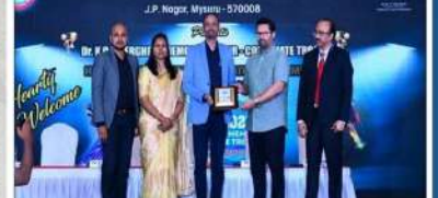
ಹಿಂದೂಸ್ತಾನ್ ನಲ್ಲಿ, ನಾವು ಪ್ರತಿಯೊಬ್ಬ ವಿದ್ಯಾರ್ಥಿಯ ಸಂಪೂರ್ಣ ಸಾಮರ್ಥ್ಯ ಅಪರ ವ್ಯವಸ್ಥಾಪಕ ಕೌಶಲ್ಯ, ತಾಂತ್ರಿಕ ದೀರ್ಘತೆ ಮತ್ತು ಸಾಂಸ್ಕೃತಿಕ ಸಂವೇದನೆಗಳನ್ನು - ಪ್ರೋತ್ಸಾಹಿಸುವಲ್ಲಿ ನಂಬಿಕೆ ತಂದ ಬಾಗಿ ತಮ್ಮನ್ನು ತಾವು ಪಾಲಿಸಲು, ನವೀನ ವಿಚಿತ್ರಗಳನ್ನು ವಿವಿಧ ರೀತಿಯ ವಿಭಿನ್ನವಾದ ವಿಚಿತ್ರಗಳನ್ನು ಮತ್ತು ಅವರ ವ್ಯಕ್ತಿತ್ವದ ಪ್ರಯೋಗವನ್ನು ರೂಪಿಸುವ ಅರ್ಥಪೂರ್ಣ ಸಂವರ್ತನೆಗಳನ್ನು ರೂಪಿಸುವ ಸೆಕ್ಟಾ -2025 ವೇದಿಕೆಯಾಗಿ ಕಾರ್ಯನಿರ್ವಹಿಸಿದೆ. ವಿದ್ಯಾರ್ಥಿಗಳು ಉತ್ಸಾಹ ಭರಿತ ಭಾಗವಹಿಸುವಿಕೆಯು ಈ ಕಾರ್ಯಕ್ರಮಕ್ಕೆ ಮತ್ತಷ್ಟು ಬೆಂಬಲವನ್ನು ನೀಡಿದೆ. ಸೆಕ್ಟಾ 2025, ಶೈಕ್ಷಣಿಕ ಮತ್ತು ಸಾಂಸ್ಕೃತಿಕ ನೆಲೆಯಲ್ಲಿ ವರ್ಗೀಸ್ ಅಂತರ ಕಾಲೇಜು ಸ್ಪರ್ಧೆಗಳನ್ನು ಒಳಗೊಂಡಿತ್ತು.